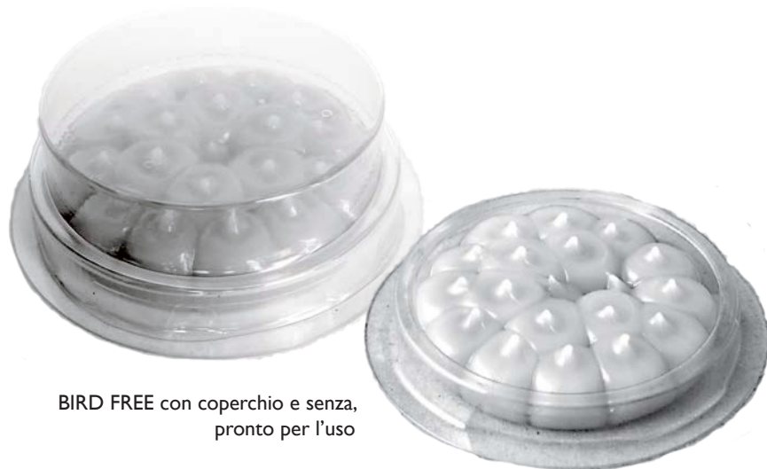
BIRD FREE con coperchio e senza, pronto per l'uso